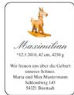
Musteranzeigen Geburt jeweils: 1sp / 60mm hoch. Alle Preise in Euro, inkl. MwSt. Es gelten die allgemeinen Geschäftsbedingungen der allgemein gültigen Preisliste Tageszeitungen der Rhein Main Presse Werbevermarktung Nr. 45, gültig ab 1. Januar 2017.