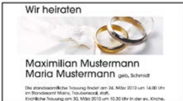
Musteranzeige Hochzeit: 2sp / 60mm hoch. Alle Preise in Euro, inkl. MwSt. Es gelten die allgemeinen Geschäftsbedingungen der allgemein gültigen Preisliste Tageszeitungen der Rhein Main Presse Werbevermarktung Nr. 45, gültig ab 1. Januar 2017.