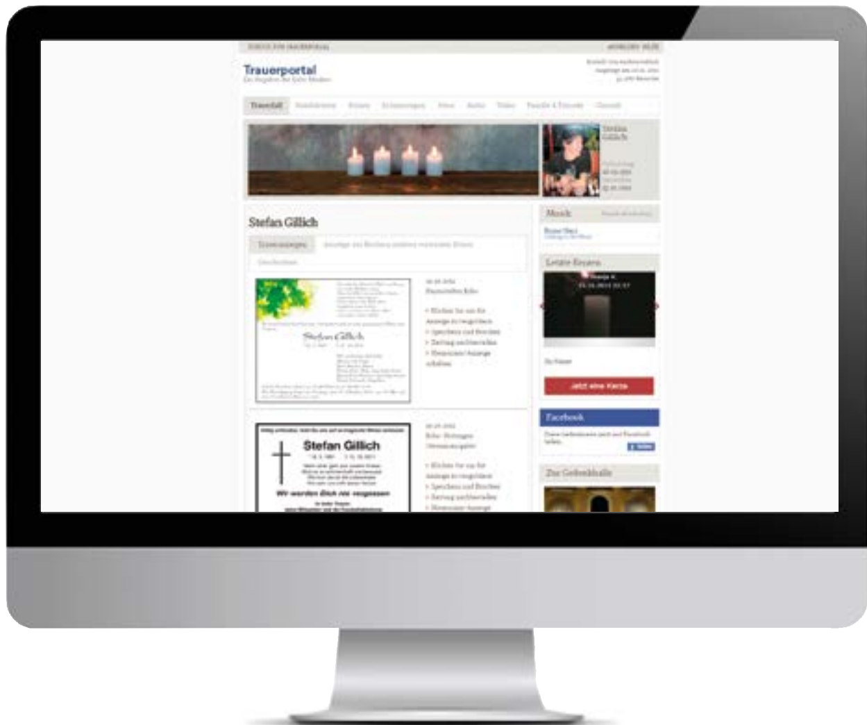
Die Gedenkseite des Trauerportals. Bsp.: Echo

trauer.rhein-main-presse.de trauer.echo-online.de